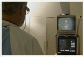
Doctors say many patients start chemotherapy without being fully informed about the procedure.

par Reuben Chow Natural News, February 02, 2009