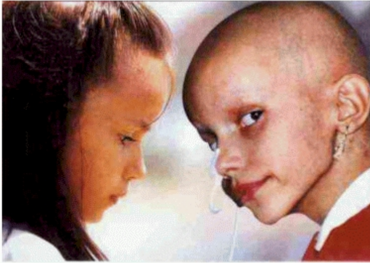
Avant et pendant la chimiothérapie